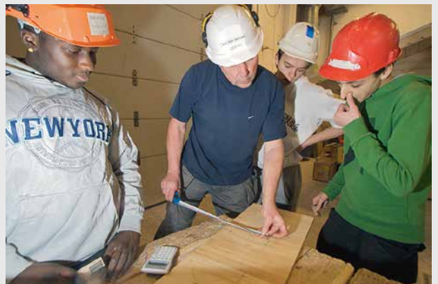
Flere fullfører skole og læretid, viser statistikken.

De siste SSB-tallene kommer fra 2019 og dreier seg om dem som begynte på videregående seks år tidligere, i 2013. Av dem hadde hele 66,6 prosent fullført. 5,9 prosent utdannet seg ennå, 5,1 prosent hadde strøket, mens 22,4 prosent hadde sluttet. I skoleåret 2019–20 sluttet 4,9 prosent av elevene på bygg- og anleggsteknikk.