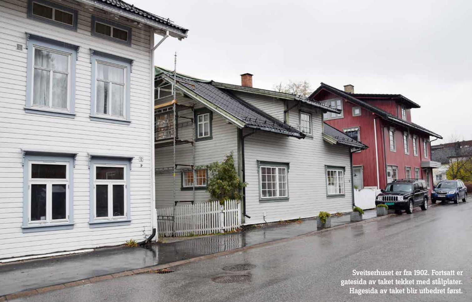
Sveitserhuset er fra 1902. Fortsatt er gatesida av taket tekket med stålplater. Hagesida av taket blir utbedret først.

AV PER BJØRN LOTHERINGTON PBL@BYGGMESTEREN.AS