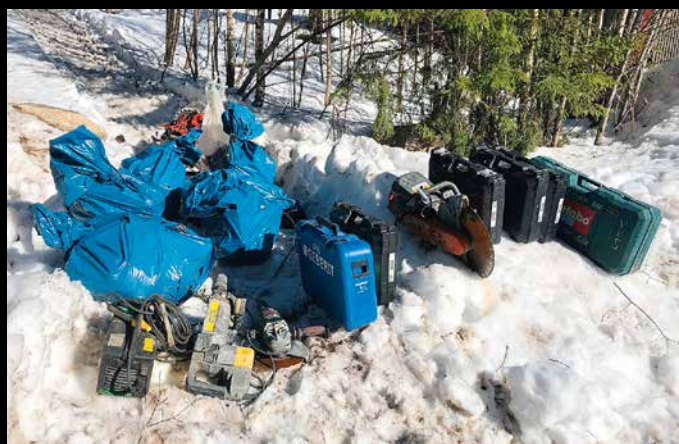
Stjålet verktøy som ble mellomlagret før transport ut av Norge. Ofte opererer verktøybandene med to lag: Ett som bryter seg inn og skjuler tyvegods før et annet lag henter det ut av landet.

Det var feil fremgangsmåte, svarte politiet og henla innbruddet samme dag.