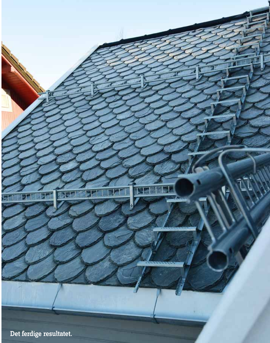
Det ferdige resultatet.