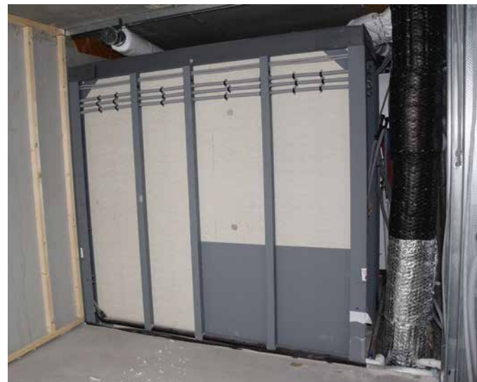
Baderommene kommer som tette bokser i metallramme. Rør og elektrisk kobles til fra utsida.