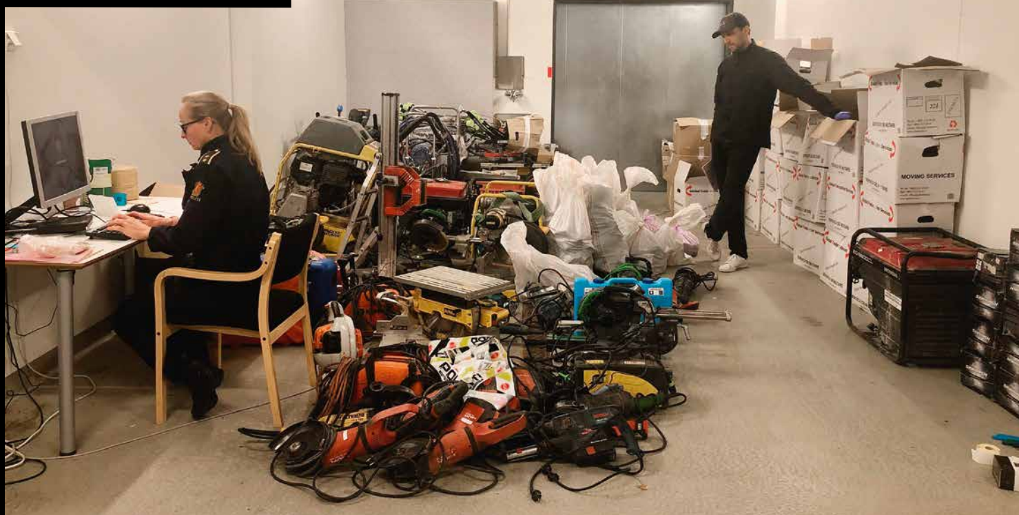
Arbeid med beslag fra grensa til Romania høsten 2020. Verktøyet ble sporet til et titalls innbrudd i 2018.