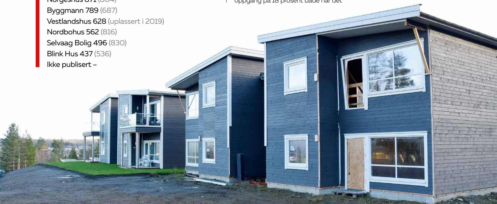
Ett av boligprosjektene som Nordbohus bygde på Raufoss i fjor.

Wedvik er likevel ikke fornøyd med at gruppa bare nådde 461 igangsettinger i fjor og dermed ikke nådde opp på Ti på topp-lista. Men han er fornøyd med at de inngikk nesten 800 kontrakter til en totalverdi på 2,7 milliarder kroner. Det var bedre enn i 2019, framgår det av en pressemelding.