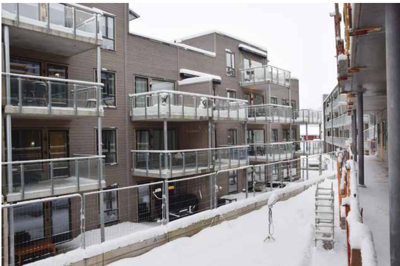
Blokkene ligger tett og er bygd i flere byggetrinn i takt med salget.

– I mange år har vi slitt med å rekruttere norske tømrere og betongarbeidere, derfor er det flest utenlandske ansatte hos oss. Vi er godt fornøyd med jobben de gjør og anser dem som en naturlig del av firmaet, fastslår den daglige lederen. ■