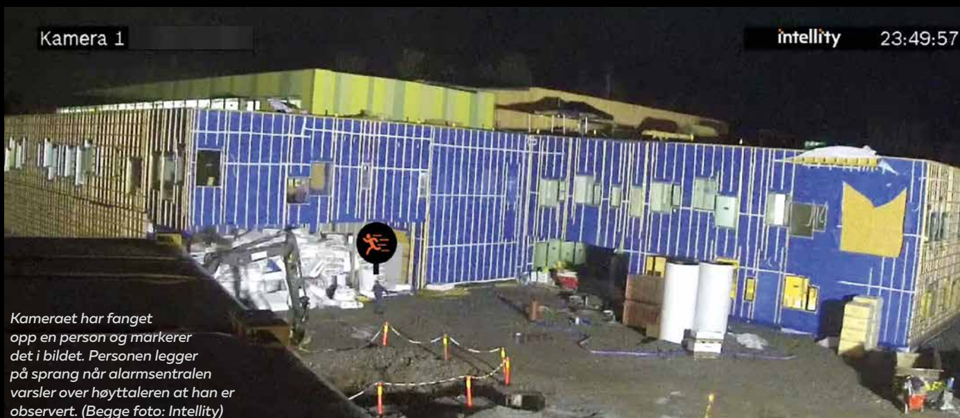
Kameraet har fanget opp en person og markerer det i bildet. Personen legger på sprang når alarmsentralen varsler over høyttaleren at han er observert.

Skap med to kamera og høyttaler skal være lett å montere på et egnet sted.