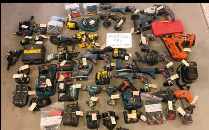
Når politiet tar beslag i stjålet verktøy, starter en stor jobb med å finne eierne.