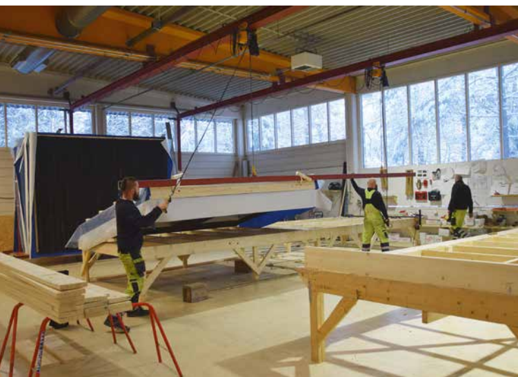
Enda ett element er klart til levering. Dette skal til fritidsboligene på Hafjell.