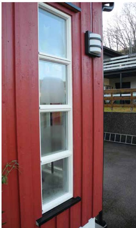
Det kan ikke regnes som en feil eller mangel at det dogger på nye vinduer, konstaterer Follo tingrett i en dom.

Forbrukeren ville dokumentere manglene med to takstrapporter. Retten festet ikke lit til dem fordi de ikke var basert på selvstendige undersøkelser. De støttet seg utelukkende på forbrukerens opplysninger. Manglene som ble påpekt, var