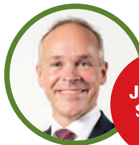
JAN TORE SANNER